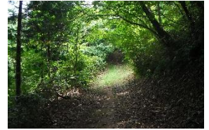
連日雨だったがぬかるむことはない