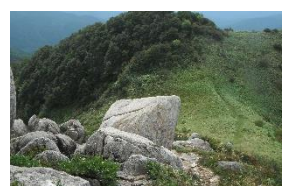
•三角点は向こうに