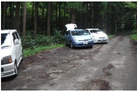
179号線入口にも案内板、迷わない

•登山開始 10:12~結界風岩 11:17 ~山頂 11:35 下山開始 12:31~登山口 13:34 登り1:24 下り 1:03