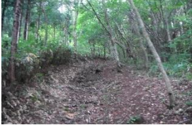
整備された登山路