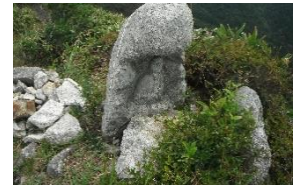
•山頂の役行者石造