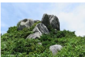
山自体がご神体か