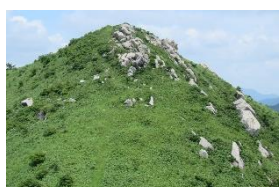
こちらからの眺め断トツ