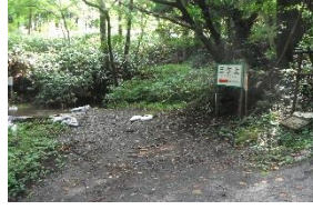
駐車可能は4台まで