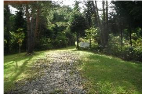
ここにも駐車可能