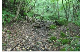
7月の豪雨で表土流出し石ころだらけに