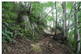
修験道に多くみられる結界風岩