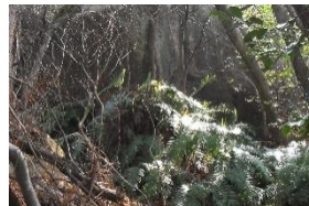
倒木で塞がれた箇所 もある