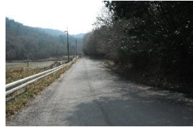
舗装道路は疲れる