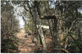
磐座Gでもここまで来ることは少ない

案内図に載っていない経山分岐から馬頭観音までは標識なく、マークが頼りとなるがそのマークも少ない。特に、平端峠から右に入る箇所は分かり難しく、途中は倒木もあるので注意必要。