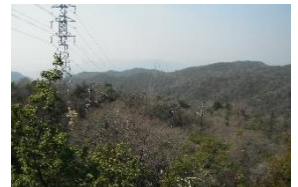
この送電線は岩屋方 向へ