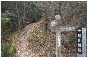
しっかりした道標設置