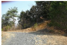
10:10 表示ないが ここが入り口、右へ