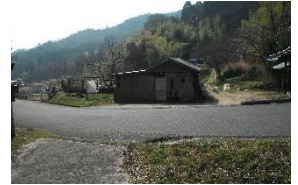
14:20 鬼の釜、この直ぐ下から経山へ