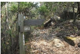
11:00 ようやく コースに出る