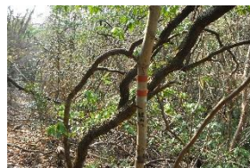
貴重な少ないマーク