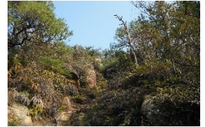
送電線が位置決めに