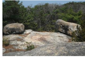
ここで山ごはん&ビール