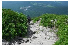
足下確認しながら一步一步