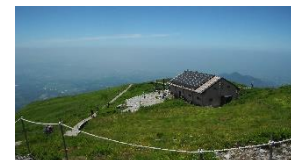
避難小屋、霞む弓ヶ浜