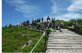
•休憩食事をする人で一杯