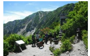
一番奥の谷が三鈷峰からの砂滑り箇所