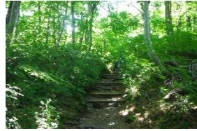
下山駐車は満杯、皆さん早い