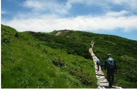
傾斜は緩いが結構堪える