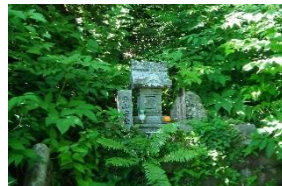
山ノ神 無事下山を