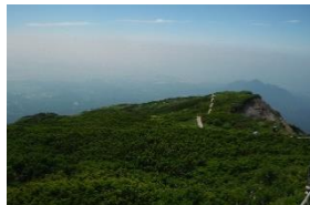
分岐から左に石室