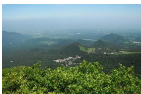
麓の豪円山 (温泉あり)