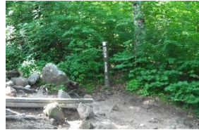
9:38 三合目 大山階段始まる