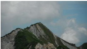
登っている人います、三鈷峰側からか