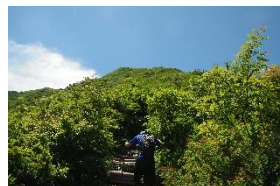
ここが一番キツイかも