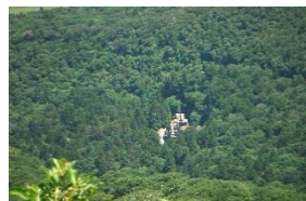
三鈷峰登山口となる大神山神社