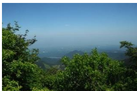
美保湾は霞んでいて見えない