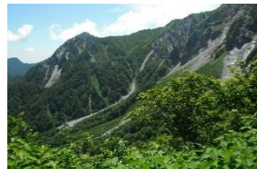
10:41 ベンチと避難小屋