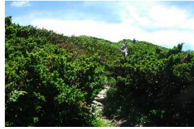
•ダイセンキャラボクの中を歩く