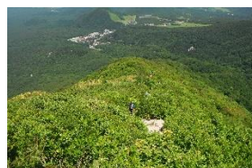
ここが一番キツイかも