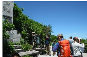
六合目、見晴らし良く誰もが休憩