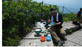
Kさんのひっぱりうどん