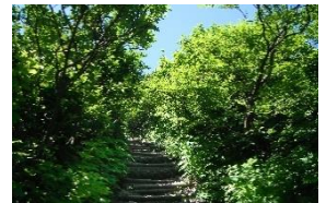
樹木も低木に変化